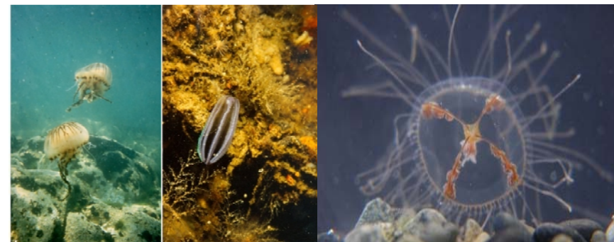
Links een Kompaskwal, midden een Meloenkwal (ribkwal) en rechts een Kruiskwal (vergroting).

De ribkwallen zijn doorzichtig en vertonen in het zonlicht witte strepen. Ribkwallen komen in Zeeland veel en vaak voor, maar vallen weinig op. Ze hebben geen netelcellen en steken niet. De Kruiskwal hoort bij de medusen, een aparte groep.