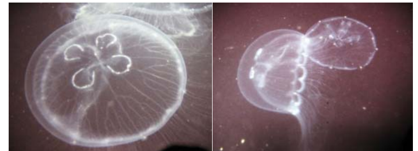
Oorkwallen in het Veerse Meer, doorzichtig en geen tentakels: ongevaarlijk.

Niet stekende kwallen zijn doorzichtig. Deze kwallen hebben geen lange losse tentakels en hebben weinig tot geen kleur. Een voorbeeld is de Oorkwal, die de laatste tijd veel in het Veerse Meer voorkomt. Deze is te herkennen aan de vier witte rondjes in het midden van de kwal, zie de foto's.