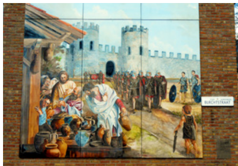
Impressie op muur, tegenover castellum Aardenburg

De Romeinen bouwden hier een ommuurd castellum. In de Middeleeuwen groeide dit plaatsje 'Rodenburg' uit tot een bloeiende handelshaven. De Sint-Bataafskerk draagt nog steeds een schip op haar toren. Na de 14 e eeuw trad verval in. De 17 e -eeuwse omwalling kwam rond een sterk gekrompen Aardenburg. De fontein met kikkers is een knipoog naar de spotnaam van de Aardenburgenaars. Fiets nu om de fontein heen (Kaai) en ga verder noordwaarts via de Haven en de Draaibrugse weg. Na de rotonde verder op de Draaibrugse